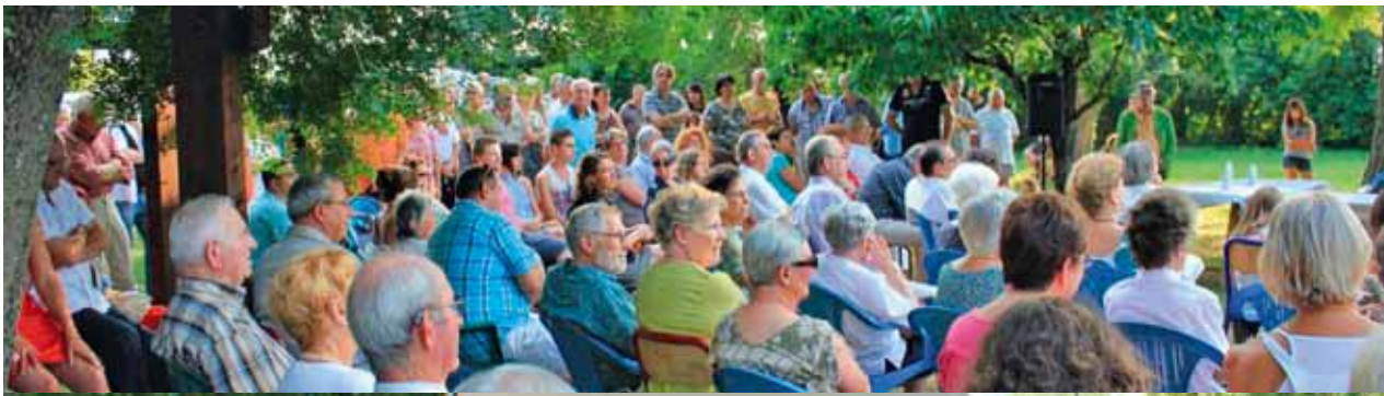
Apéritif du 14 juillet dans le cadre champêtre des Jardins de l'Ancien moulin