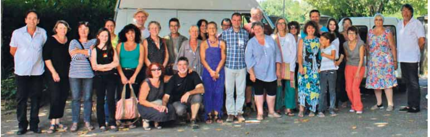
Pour la deuxième année le petit marché a pris de l'ampleur : il est passé d'une vingtaine à une trentaine d'exposants qui proposent des productions locales, avec un secteur de produits biologiques, légumes, volailles, fromages de chèvres, safran, miels, œufs pains...et la présence d'artisans qui présentent des œuvres de leur création, comme les poteries, les bijoux, les objets en tissus...