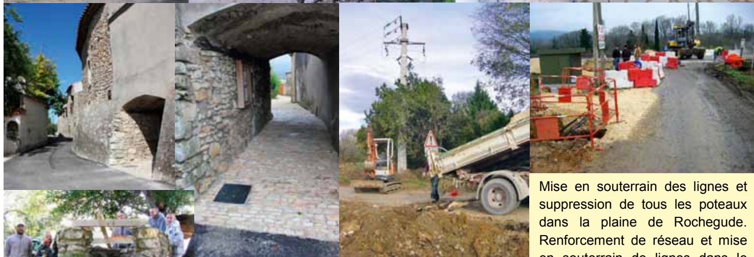
BELBUIS : aménagement global du hameau