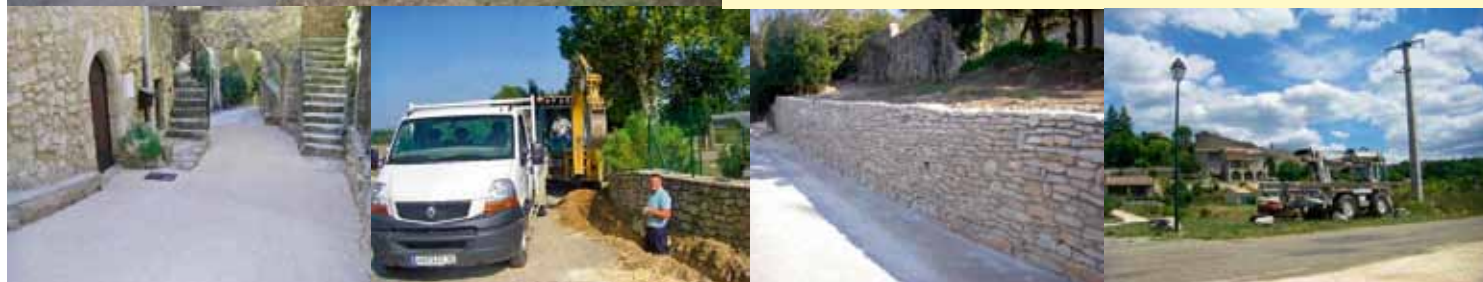
ROCHEGUDE : Aménagement du parvis et de la rue de l'église, rénovation du Chemin des Bois et de la calade de l'école