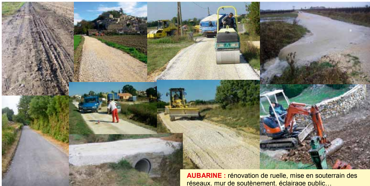
AUBARINE : rénovation de ruelle, mise en souterrain des réseaux. mur de soutènement. éclairage public...

Des travaux qui ont concerné 50 % de la voirie communale dans tous les secteurs de la commune : Aubarine, le Puech, la Condamine, l'Houlme, Mannas, les Cazernes, Belbuis, les Moulens, les Rouvières, Courlas, Mas Huc, Rochegude, la Plaine