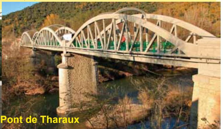
Travaux au Pont de Tharoux